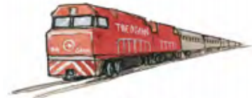
Tåget The Ghan går genom hela Australien.

Resan med tåget går längs den röda linjen.